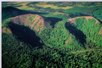
Puys de la Vache et de Lassolas