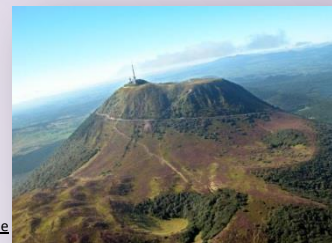
Puy de Dôme