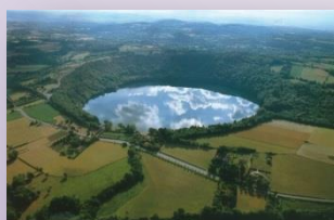
Gour de Tazenat