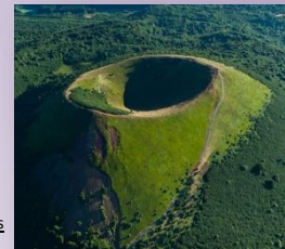
Puy des Goules