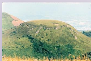
Puy de Clerzou